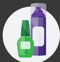
Cosméticos y productos de cuidado personal