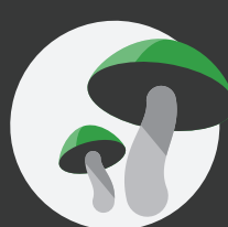
Plantas y hongos