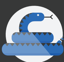
Moridas y picaduras de animales