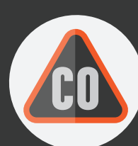
Monóxido de carbono

Información* reportada por el sistema nacional de datos del "American Association of Poison Control" (2017)**